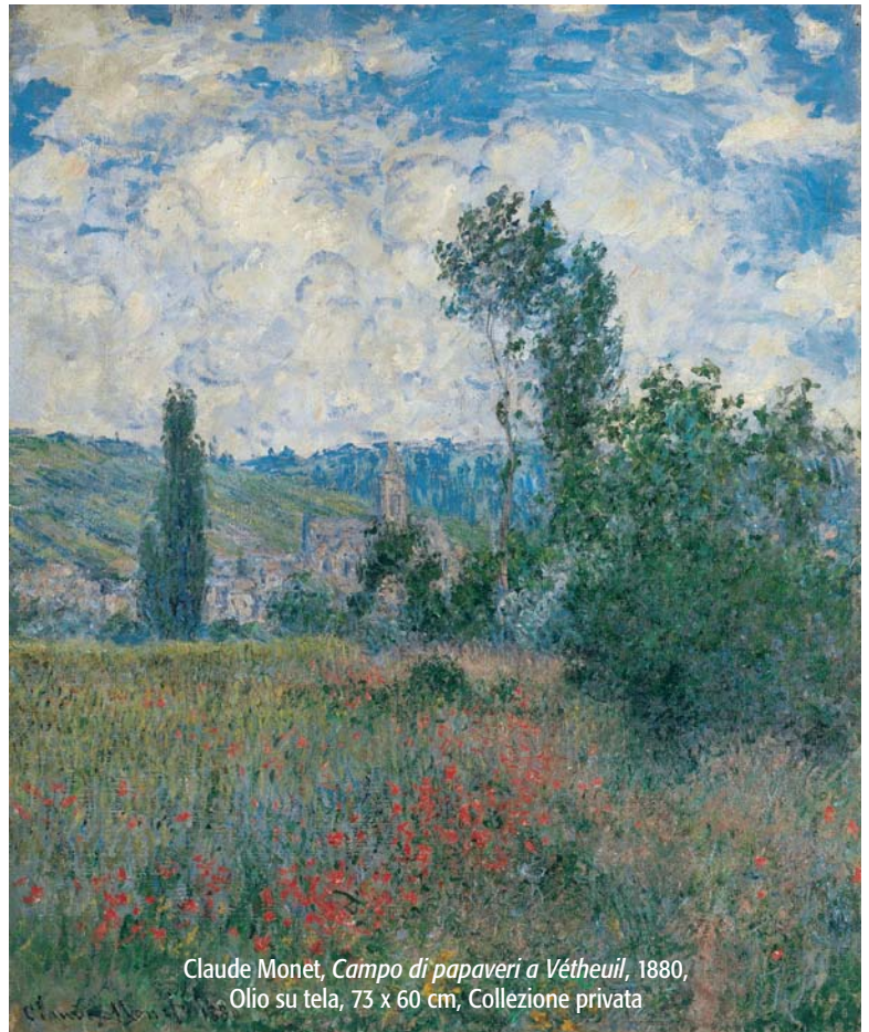
Claude Monet, Campo di papaveri a Vétheuil , 1880, Olio su tela, 73 x 60 cm, Collezione privata

Invece di immaginarsi un mondo senza crescita o cedere al catastrofismo illuminato, osiamo dire qui che la crisi attuale, finanziaria, economica, ambientale e sociale, che colpisce l'Europa con una disoc-